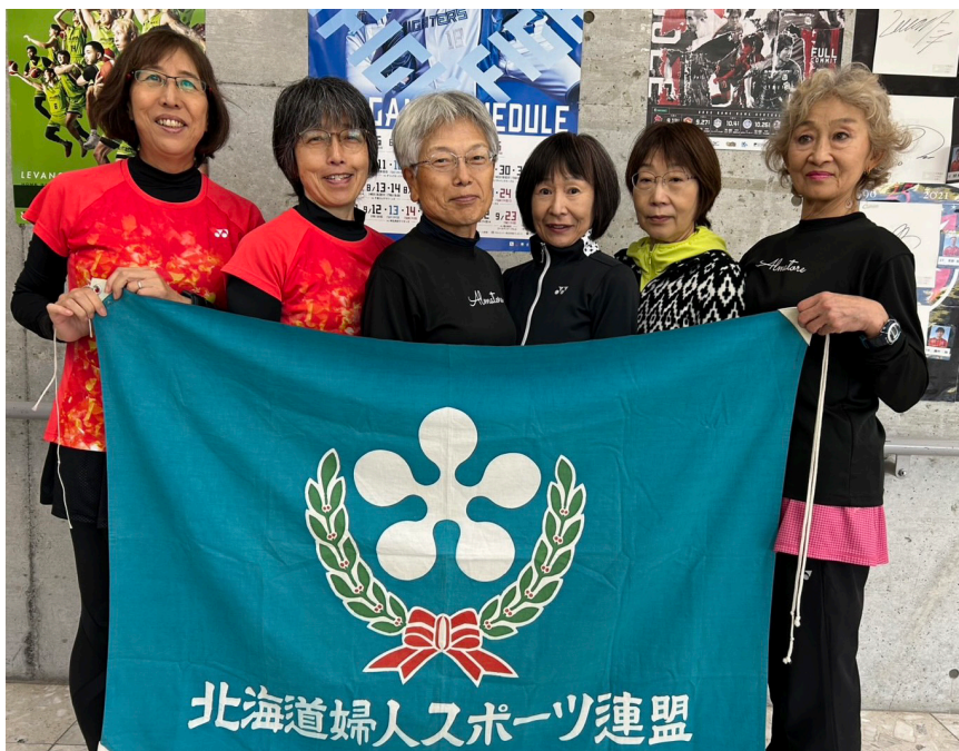
CD級優勝 シルバー☆シヨット