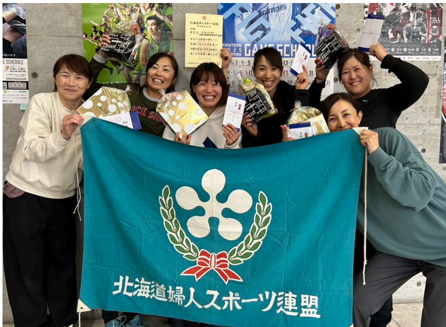
AB級優勝 ぴよんたろう